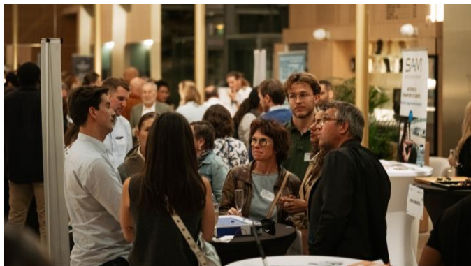
La démozone : échanges et tests des solutions.