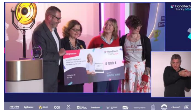
Replay de la Remise des Prix ici .