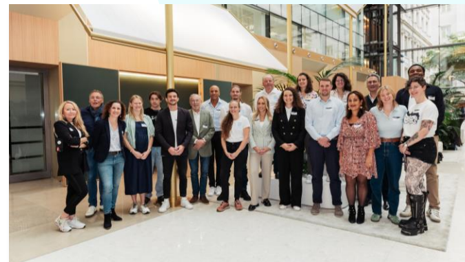
Les finalistes de cette 8 e saison.