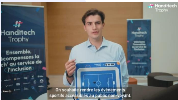
Pitch vidéo de touch2see, lauréat Sport : Jop 2024.